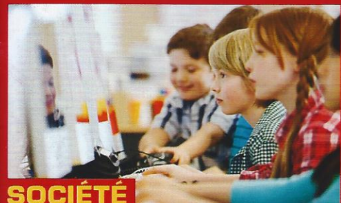
SOCIÉTÉ L'école joue-t-elle encore son rôle d'ascenseur social ?

ENQUÊTE Notre pays peut-il s'adapter au boom des seniors ?