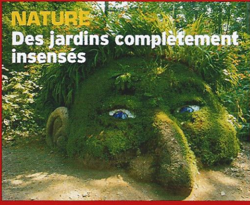
NATURE Des jardins complètement insensés

ENQUÊTE Notre pays peut-il s'adapter au boom des seniors ?