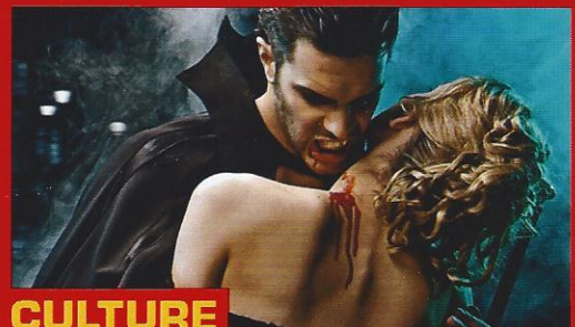
CULTURE Pourquoi Dracula fait-il autant d'émules ?